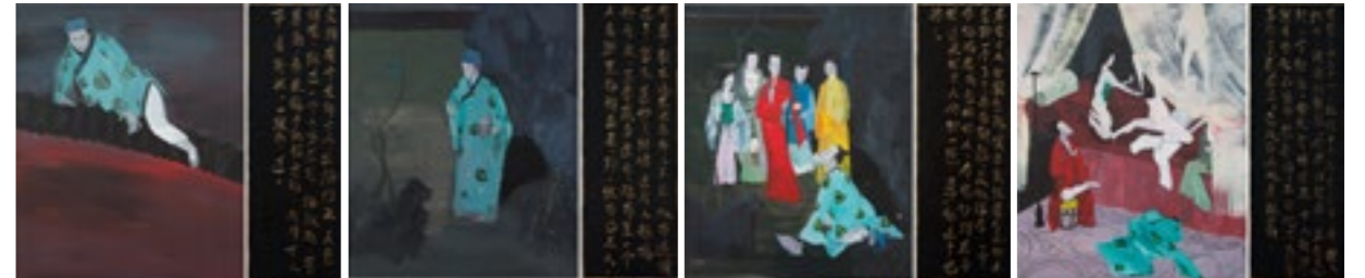
הסוף האינסופי קרב 2 , אקריליק על לוח עץ