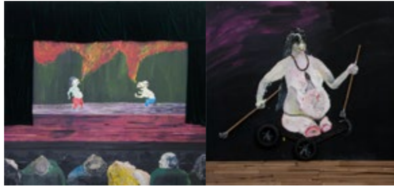
הסוף האינסופי קרב 5 , אקריליק וטכניקה מעורבת על לוח עץ