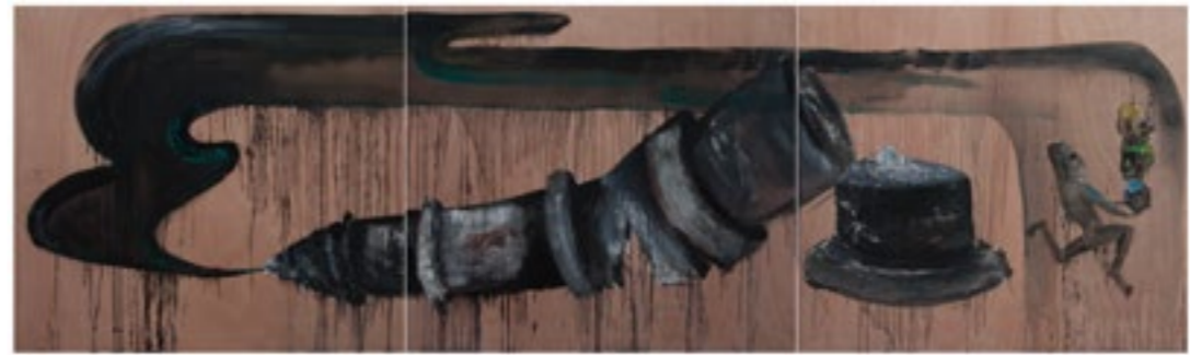
הסוף האינסופי קרב 1 , אקריליק וטכניקה מעורבת על לוח עץ