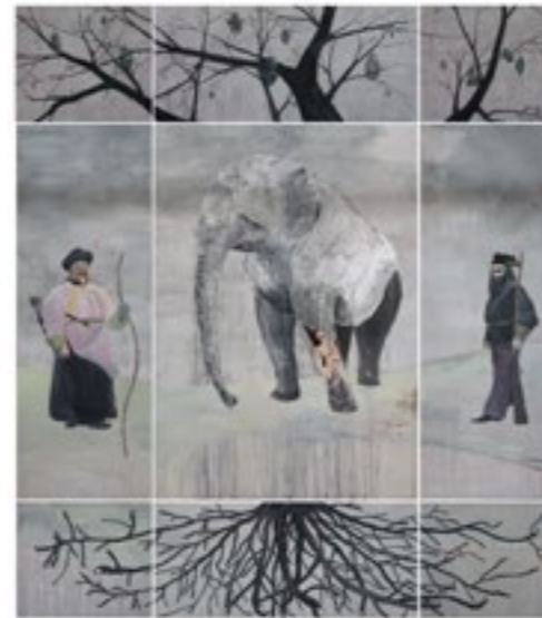
הסוף האינסופי קרב 3 , אקריליק וטכניקה מעורבת על לוח עץ