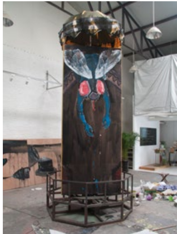
הסוף האינסופי קרב 7 , מיצב ציור: עץ, ברזל, מנוע, מטרייה אקריליק, טכניקה מעורבת זו עבודה תלת-ממדית, אז דרושה גם מידת עומק